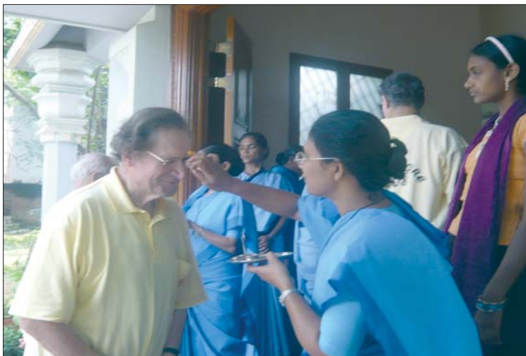
... accoglienza ...indiana!

rituali - che hanno apportato luce e bellezza alle celebrazioni liturgiche - hanno incantato i fratelli; pregare con dei fiori, con la danza, simboli attinti alla tradizione indiana, è stato per parecchi una straordinaria scoperta!