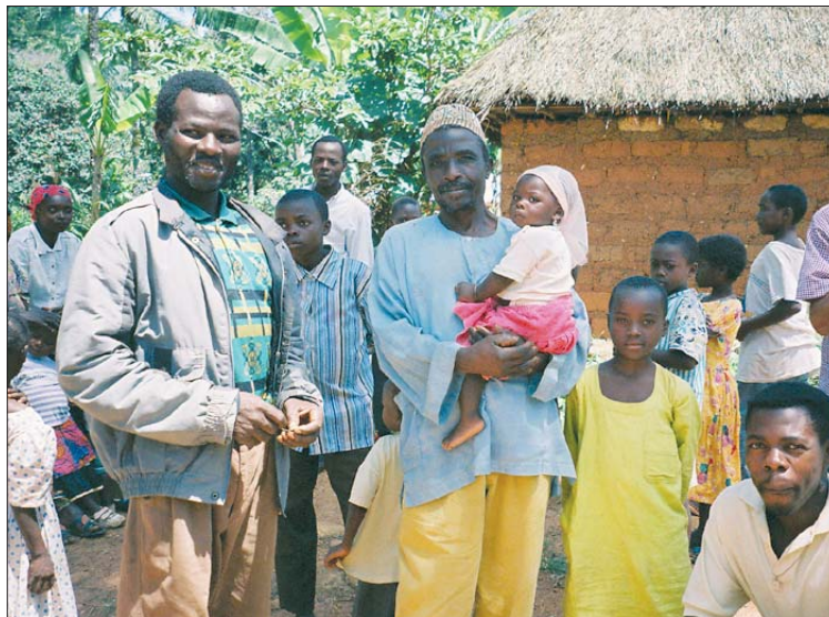
amicizie ... durante le visite ai villaggi!

momenti straordinari di condivisione con loro, le loro famiglie, gli amici cristiani e musulmani dei loro quartieri, senza dimenticare il nostro quartiere di Njindare a Foumban; non è dunque perché io non sono più là che tutto va in rovina. Nella Regione dell'Africa centrale ci sono 13 fratelli pieni di dinamismo, dunque la mia mancanza è cosa abbastanza relativa: «le cose importanti che si vivono sono invisibile agli occhi», ...e la vita continua!!!