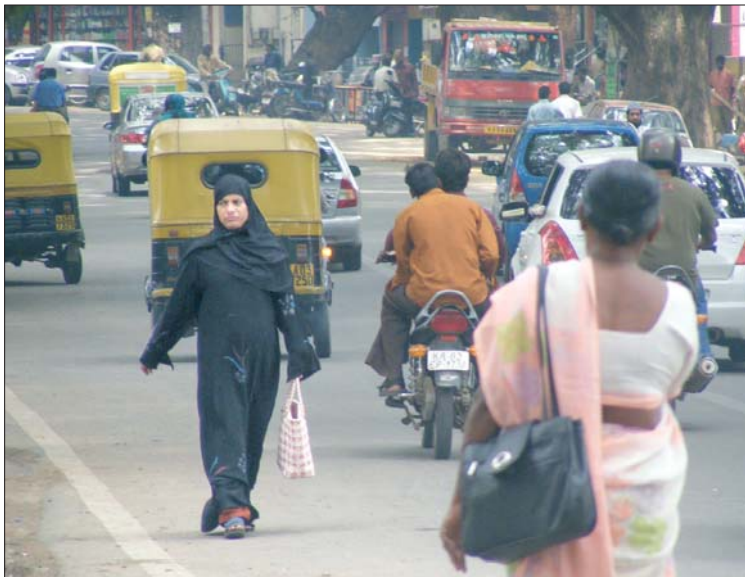
Realtà quotidiana per le vie di Bangalore.

La ricchezza dell'accoglienza, delle espressioni culturali e