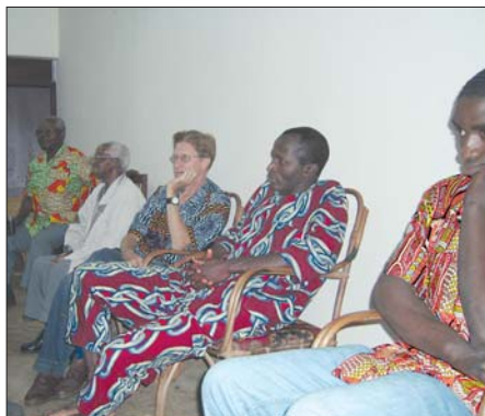
Momenti di riflessione - Africa centrale.

Prima di tutto, ascoltando i fratelli, cercando di comprendere come essi orientano la loro vita e le loro scelte alla nostra vocazione; come fanno il legame tra Nazaret ed il loro comportamento. Cercare il Volto Dio nella vita di ogni giorno, condividere la vita dei poveri è impor-