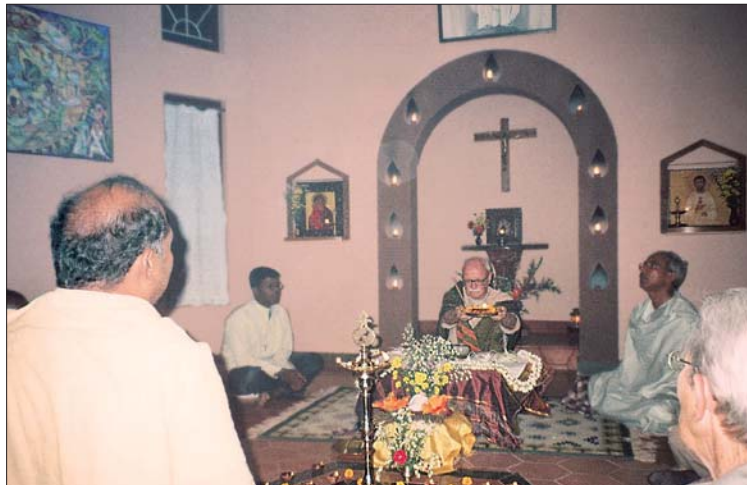
Liturgia alla Fratemità.