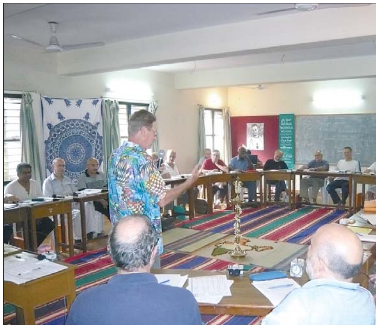
Assemblea generale: Capitolo di Bangalore.

L'ultimo Capitolo si è tenuto a Bangalore nel Sud dell'India, in una casa di formazione dei