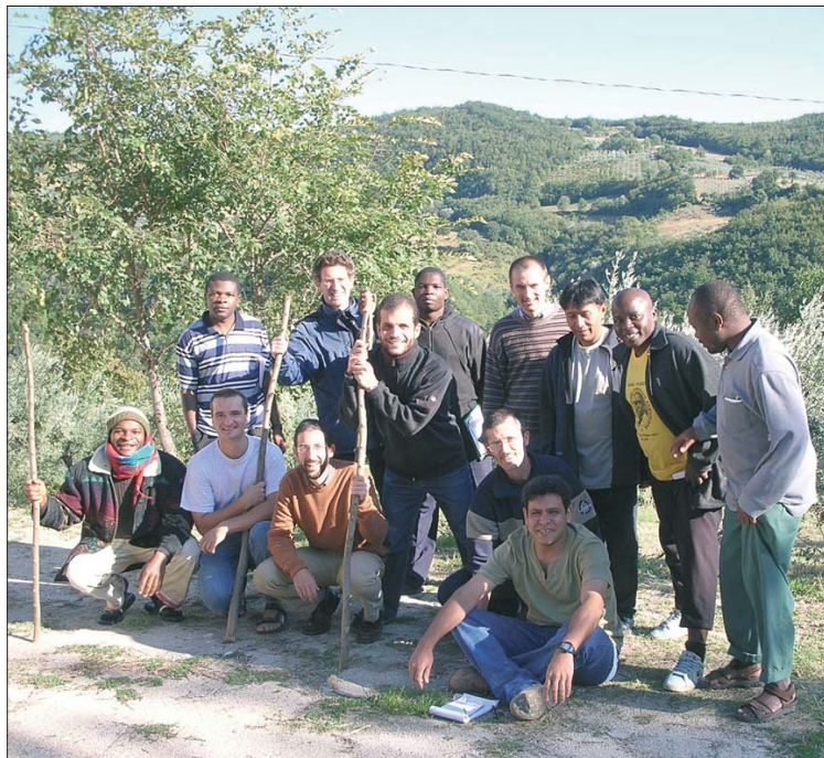
... pronti per la raccolta delle olive...

soprattutto appannaggio nostro, tra di noi. Viviamo una vita fraterna molto intensa, che ci permette di conoscerci meglio - uno degli scopi di questo anno.