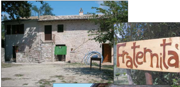
Eremito: Beata Angela.