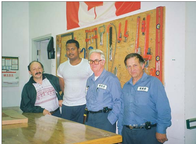
... altra cultura di lavoro...

nità, un cammino di vita, inventando nuove piste.